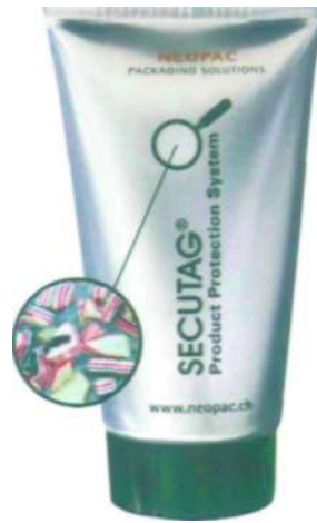
Neopac Tube mit Partikeln-fälschungssichere Verpackung mit Mikro-Farbcodes.